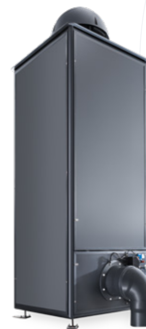
UT31110 COALSI® Volumenmax

Einsatz findet der Hochleistungsfilter nicht nur bei Pumpstationen, Übergabepunkten oder Kanalschächten, sondern auch bei belasteten Rohgasen in der Industrie.