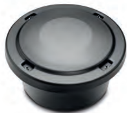
UT30120 COALSI® Mehrfachkammer- Aktivkohlefilter EST Ø 616 mm