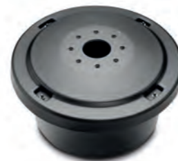
UT30122 COALSI® Mehrfachkammer- Aktivkohlefilter MST Ø 616 mm