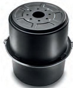
UT30124 COALSI® Mehrfachkammer- Aktivkohlefilter MSTD Ø 586 mm doppelt